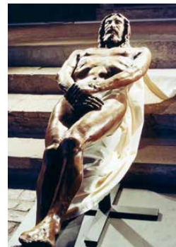
▲聖骸布に基づく実物大のキリスト像

と思います。機会を作ってくだされば、神がいのちを下さるかぎり、全国のどこでも公演する用意があります。