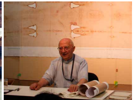
▲藤が丘教会での講演

皆様とご家族の上にチマッティ神父の取次によって神様の豊かな恵みがあるように祈ります。