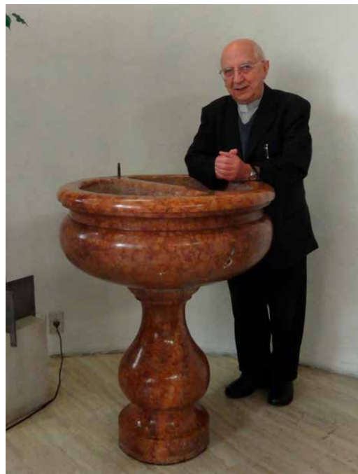
左：生まれ故郷で 60周年のミサ 右：洗礼を受けた 洗礼盤